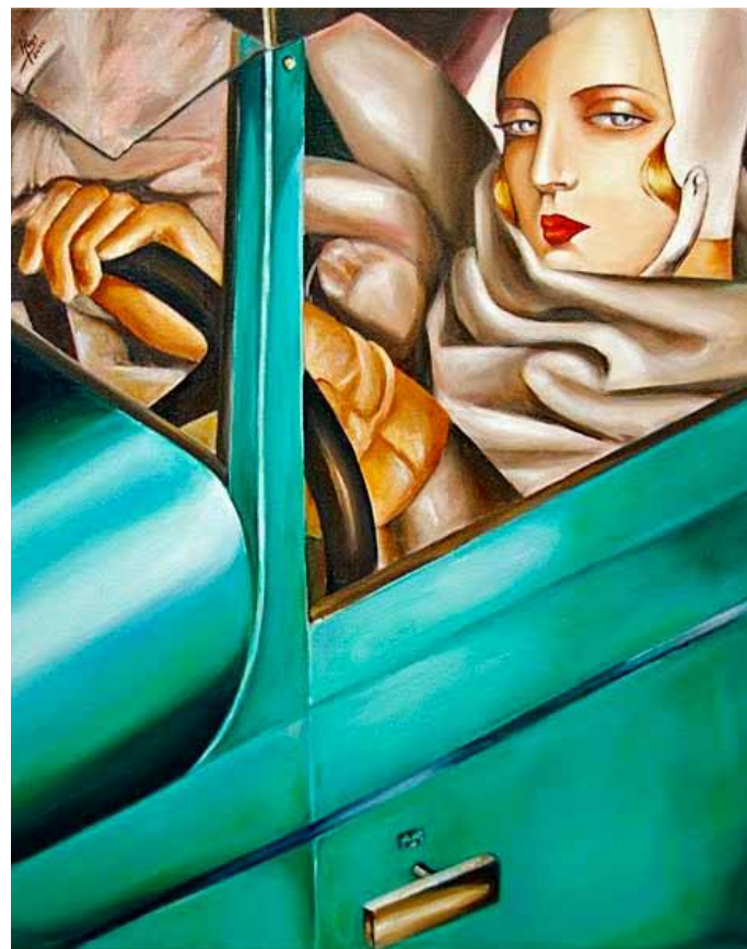
Art Deco Bugatti verde.

Con su “Autorretrato en Bugatti Verde” para la portada de una revista alemana, simboliza la emancipación de la mujer en ambientes refinados y elegantes, aunque es un homenaje a Isadora Duncan, creadora de la danza moderna que muere en Francia cuando su bufanda se enreda en una de las llantas del carro donde viaja. Muchos de los cuadros de Lempicka expresan su devoción por la sensualidad y el erotismo femenino. El Art Déco prescinde de las mujeres débiles y son plasmadas con la misma vitalidad con que se representa a hombres altivos y atléticos. Sus motivos naturalistas son estilizados y geométricos, ya se trate de flores, árboles, fuentes o aves con las que