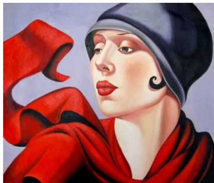
Art Deco Tamara de Lempicka.