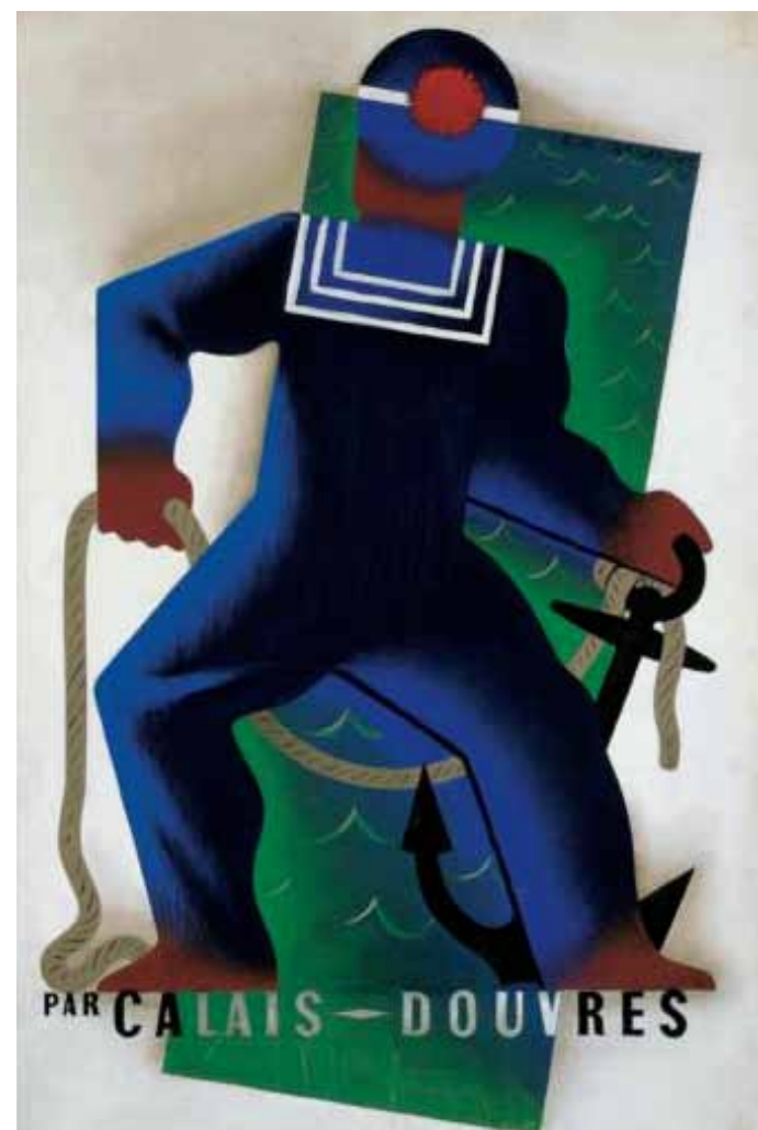
Art Deco Cassandre.

Se extiende a la joyería que, con nuevas máquinas, perfecciona la filigrana y el engaste invisible. Cartier y Van Cleef y Arpels son famosos diseñadores de cigarreras, broches y brazaletes para mujeres que empiezan a vestir con los brazos desnudos por las nuevas modas. Los joyeros experimentan con metales y piedras preciosas en figuras diversas, incluyendo escarabajos que se ponen de moda tras el destape del sarcófago de Tutankamón en Egipto (1925) considerado el más grande hallazgo arqueológico de la historia. Después de la Primera Guerra Mundial, el Art Déco es un respiro existencial de la humanidad al que tratará de sofocar una segunda oleada de muerte y destrucción iniciada, para variar, por Alemania, ahora desde el rampante fascismo hitleriano.